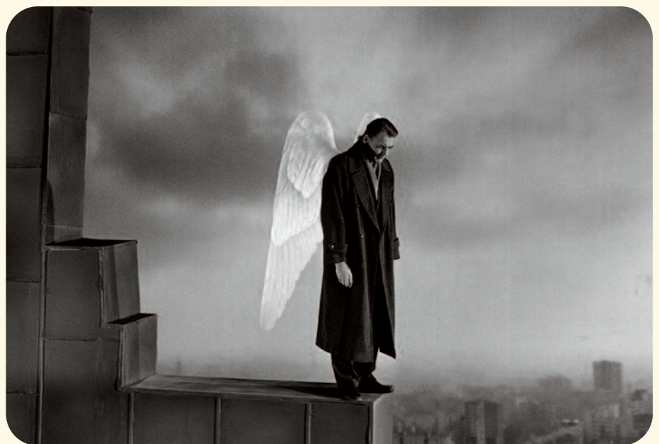
Wings of desire; een van de engelen uit de film van Wim Wenders (1987)

Moge het komende jaar gedragen worden door fluisteringen, door stilte, door gebed en door ontvankelijkheid voor de zachte krachten.