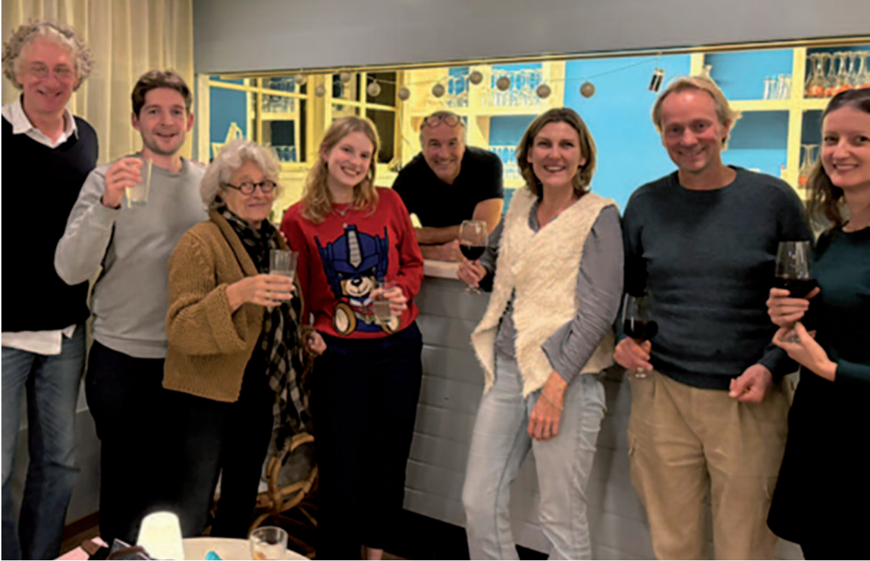
Belijdeniscatechisanten tijdens een weekend in Dopers Duin (Schoorl)