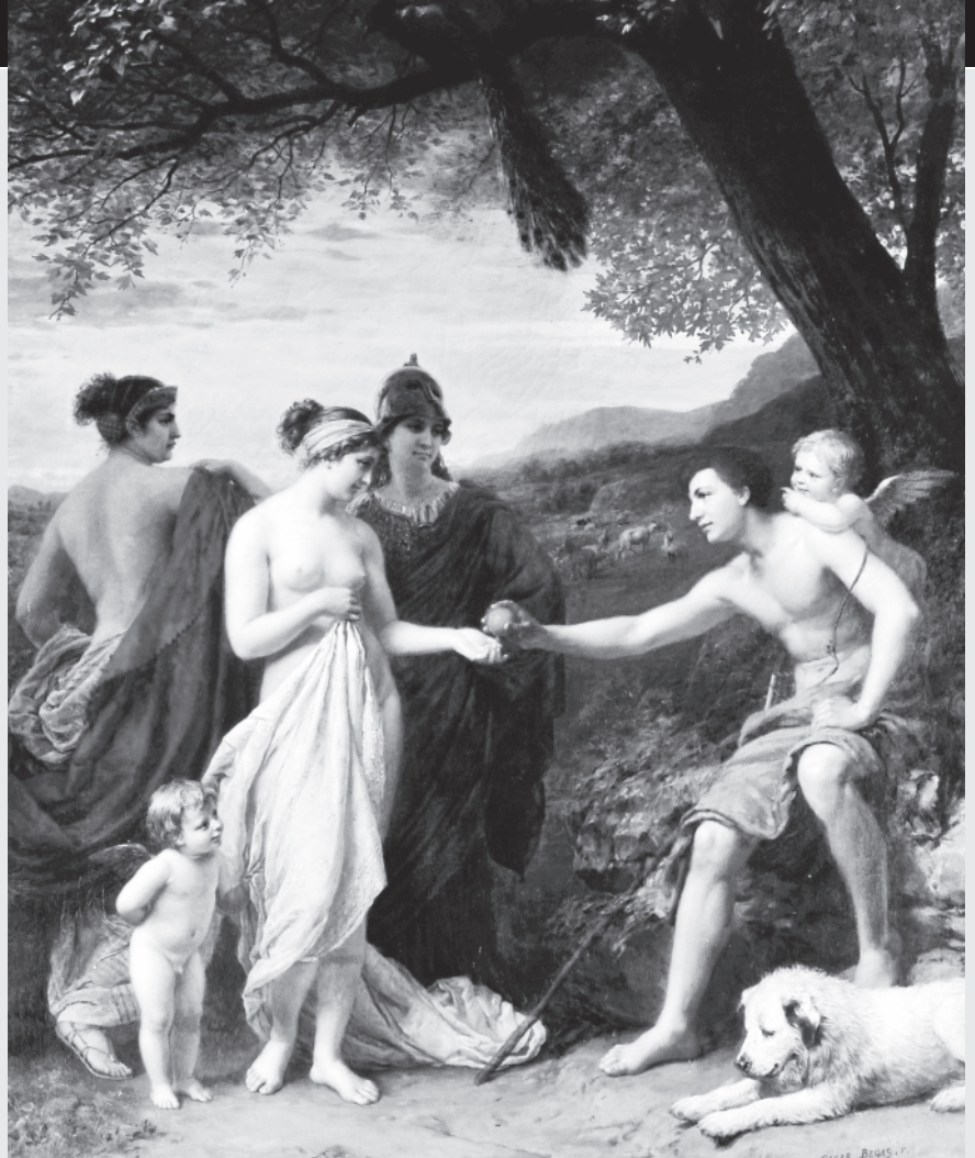
Oskar Begas, The Judgment of Paris .

In mijn visie, is het verhaal over de zondeval een poging geweest om een antwoord te vinden op de eeuwenoude diep menselijke vraag naar het waarom van de dood en van het kwaad in de wereld. Filosofen denken al sinds mensenheugenis na over deze thema's. Heel in de verte lijken de belevenissen van Adam en Eva in het oude testament verhaalelementen uit de Griekse oudheid te resoneren. Het Griekse 'hubris', niet zomaar wat overmoedigheid, maar een de goden tartend grensoverschrijdend gedrag, werd afgestraft door de goden. En die straf was altijd buitenproportioneel. Adam en Eva werden als straf voor het