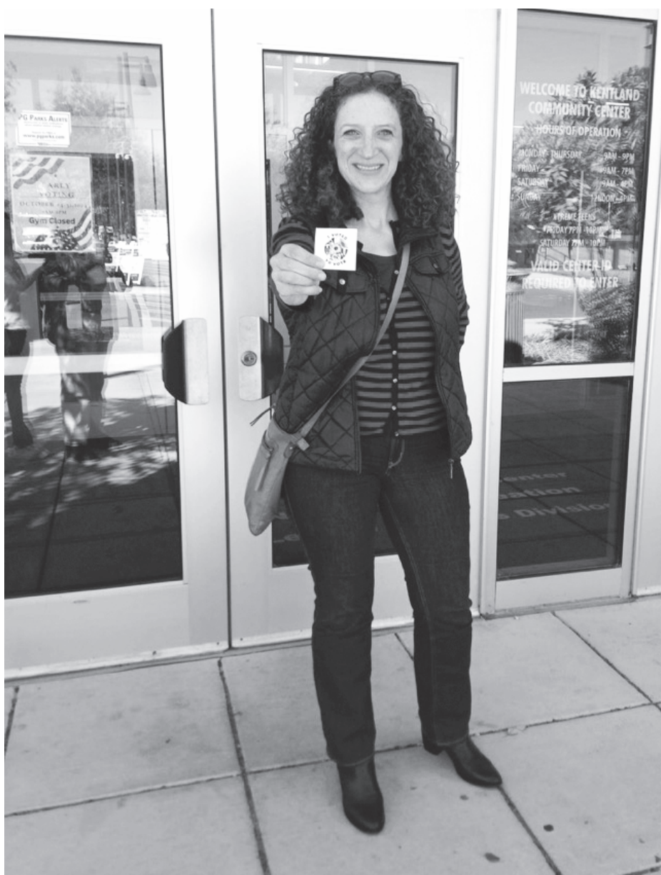
Op de eerste dag van 'early voting' in Maryland heb ik mijn stem uitgebracht!