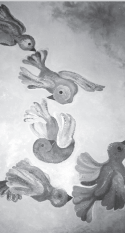
Buiteling in de lucht, Karen Lammers

ik ben het oneindig kleine, ik ben niet meer dan een passant en ik ga mijn weg met grote dromen, verloren in het oneindig grote. Ik, die slechts een klein korreltje zand ben, niet meer dan een regendruppel in de oceaan, Ik, die wil leven, die wil overleven, die de tijd wil doen stoppen, ik ben het oneindig kleine, ik ben slechts een passant, vasthoudend aan mijn leven als aan aarde verloren in het oneindig grote, en ik ga mijn weg met grote dromen, verloren in het oneindig grote.