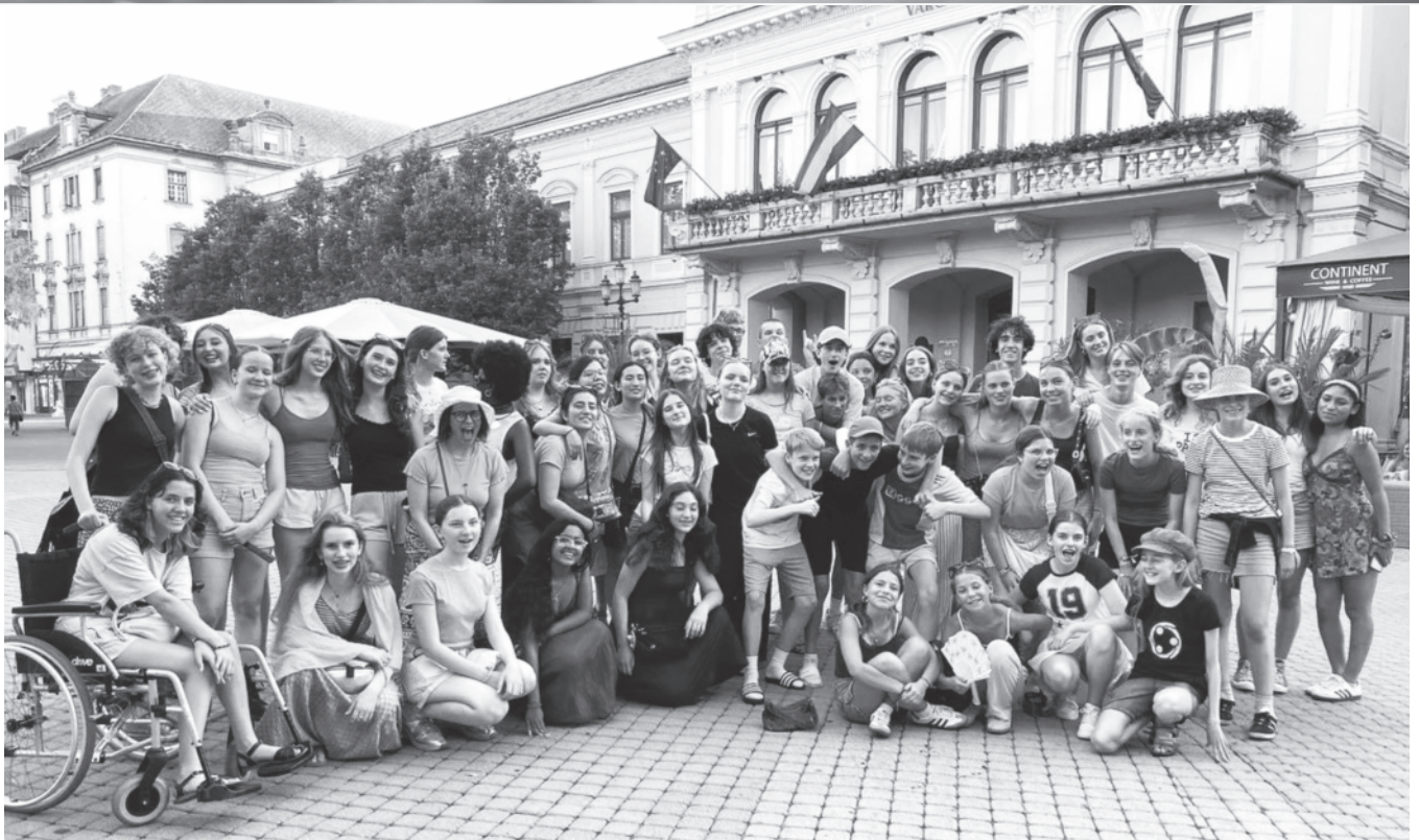
Nieuw Vocaal Amsterdam in Hongarije.

SINGELKERK 16.00 UUR | 22 SEPTEMBER 2024