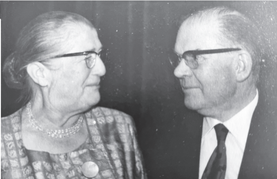
Grootouders van moeders zijde in 1964, 35 jaar getrouwd.